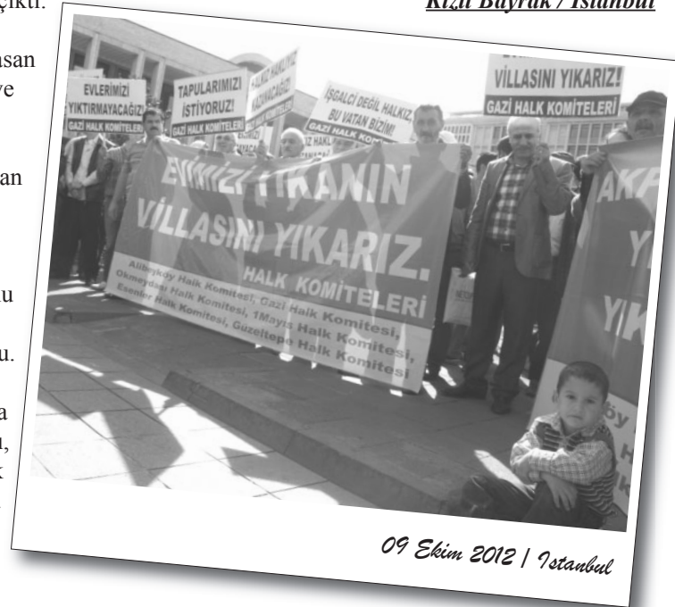
09 Ekim 2012 | İstanbul

Sermaye hükümeti AKP'nin “kentsel dönüşüm” adıyla ‘müjdelediği’ ve 5 Ekim’de başlattığı yıkımlara karşı Halk Komiteleri tarafından bir eylem yapıldı. Alibeyköy, Armutlu, Okmeydanı, 1 Mayıs, Esenler, Gazi ve Güzeltepe Halk Komiteleri tarafından örgülenen eylem 10 Ekim günü İstanbul Büyükşehir Belediyesi önünde gerçekleştirildi.